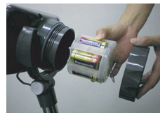
D형 간전지 6ea 사용